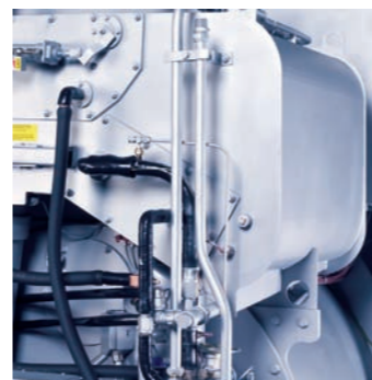
Cámara de secado aerodinámica