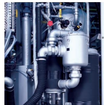
Sistema de adsorción SLIMSORBA

Con el sistema de adsorción completamente integrado SLIMSORBA usted consigue prendas libre de olores y con una concentración de disolvente especialmente baja. Mediante un sistema refrigerador del carbón completamente nuevo la capacidad del carbon se puede aumentar hasta un 50%. Así usted ahorra tiempo y dinero.