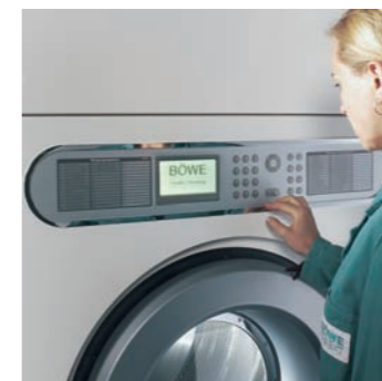
Manejo fácil hasta el mínimo detalle

El control puede ser fácilmente actualizado leyendo desde una tarjeta MMC o SD estándar.