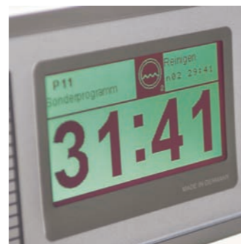
Controla el tiempo restante de funcionamiento