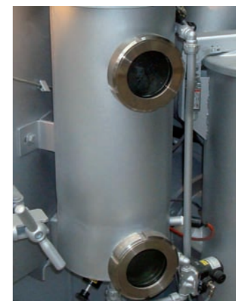
libre de mantenimiento - el separador de agua autolimpiador con según separador de agua

nación automática de residuos sin emisiones, única en el mundo, se aprovecha un principio químico que asegura la eliminación de los residuos (con bomba) y prácticamente sin disolvente.