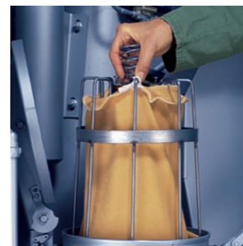
El filtro de pelusa principal: Solamente se limpia una vez al día.

Los tres depósitos de serie son autolimpiantes. Opcionalmente, las máquinas se pueden equipar con filtros de agujas autolimpiantes. Debido a nuestra elimi-