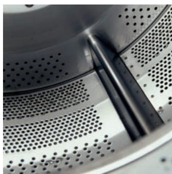
Perforación dinámica del tambor

El sistema de secado Power Drying de BÖWE ha sido optimizado con el nuevo conducto de aire aerodinámico de la Sexta Generación. De esta manera se consiguen excelentes resultados de secado y simultáneamente tiempos de carga mas cortos no comparables con otros.